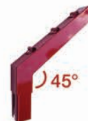
Bayoneta con ángulo de 45°